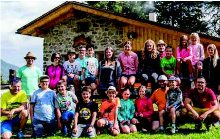
Die Jungmusikantinnen und -musikanten mit Betreuern auf der Schartalm.

Am Wochenende vom 13. bis 15. Juli fand das Hüttenlager der Musikkapelle Prad statt. Mittlerweile ist es schon zur